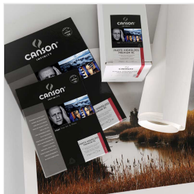
Photo High Gloss Premium RC propone un'eccezionale D-max ed un ampio gamut dei colori, rendendo questo prodotto la scelta ideale per meravigliose foto a colori.

Photo HighGloss Premium RC è stata progettata per garantire i più elevate requisiti di conservazione e rispetta gli standard della norma ISO 9706.